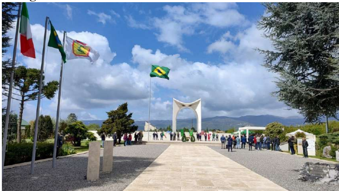
Figura 3 – Monumento Votivo Militar Brasileiro em Pistóia

Adiciona-se que, atualmente, há 5 (cinco) militares do Exército Brasileiro desempenhando funções na Itália : 1 (um) Adido, 1 (um) Assessor do Adido, 2 (dois) Auxiliares do Adido no Monumento Votivo Militar Brasileiro (Figura 3) e 1 (um) aluno do Curso de Altos Estudos em Defesa.