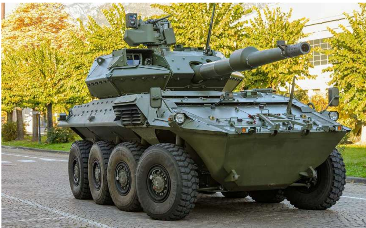
Figura 2 – Centauro 2

Fonte: Consórcio IVECO/OTO-Melara (CIO) 5