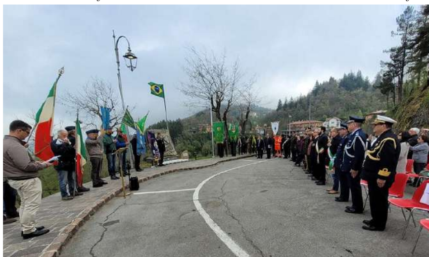
Figura 1 – Celebração da Tomada de Montese e Libertação da Itália

Cabe lembrar que as relações de amizade entre os países foram fortalecidas pelos laços forjados por ocasião da Segunda Guerra Mundial , em que 25.834 homens e mulheres da Força Expedicionária Brasileira (FEB) atuaram ao lado dos Aliados nas últimas fases da Campanha da Itália, contribuindo decisivamente para o restabelecimento da liberdade e da democracia naquele país. Desde as primeiras missões no vale do Serchio, até a sucessão de vitórias em Monte Castello, Castelnuovo, Montese, Collecchio e Fornovo di Taro, os heróis brasileiros destacaram-se pela bravura, resiliência e integridade, sendo até hoje lembrados com gratidão pela população italiana (Franco, 2021), como ilustra a Figura 1.